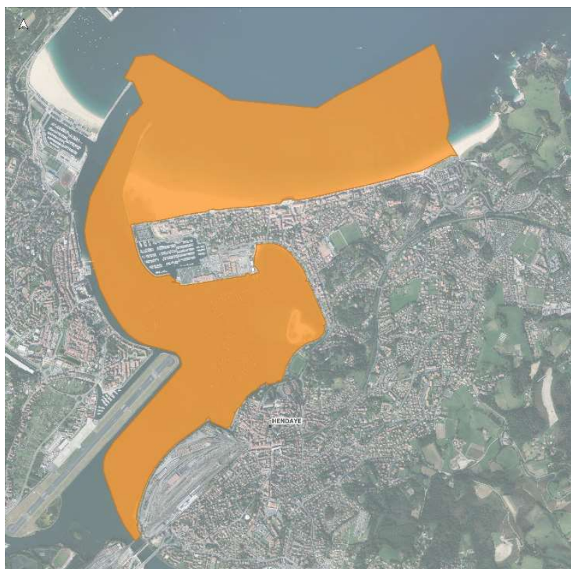
Figure 2 : Périmètre du site Natura 2000 ZSC Baie de Txingudi