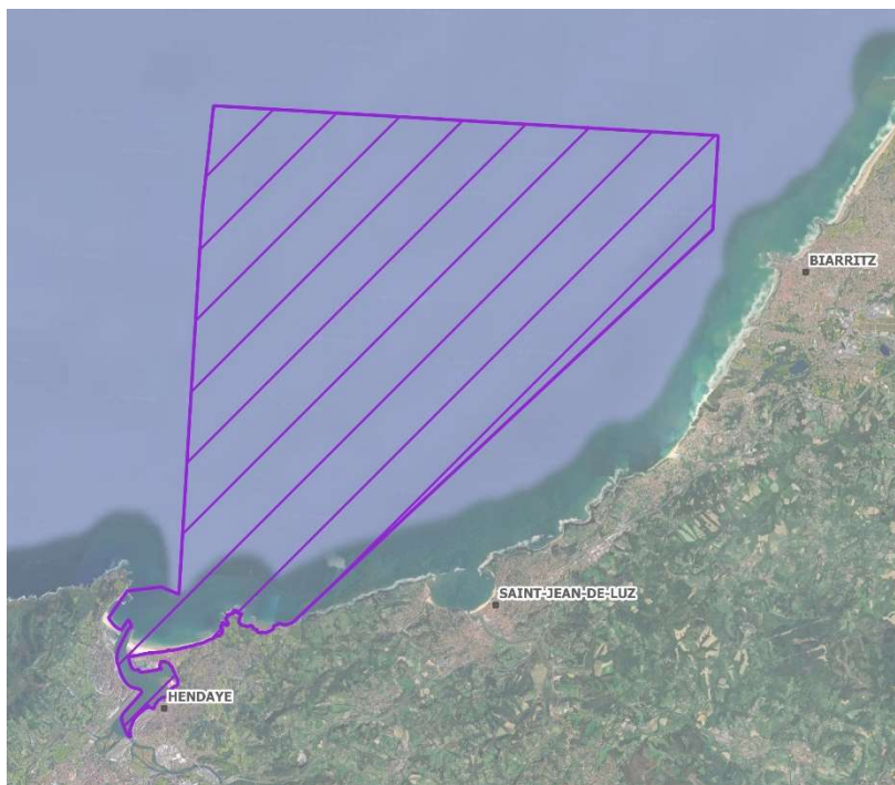
Figure 1 : Périmètre du site Natura 2000 ZPS Estuaire de la Bidassoa et baie de Fontarrabie